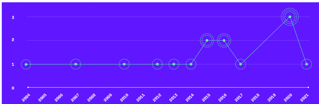
Coopératives du secteur des TI par année de création.

Dans l'ensemble, il ressort de ce rapport l'image d'un rôle de plus en plus important occupé par ces nouvelles petites coopératives dans le secteur des technologies de l'information à Montréal. Chacune est un lieu où l'on expérimente de nouveaux rapports aux autres, à l'activité économique et à l'environnement.