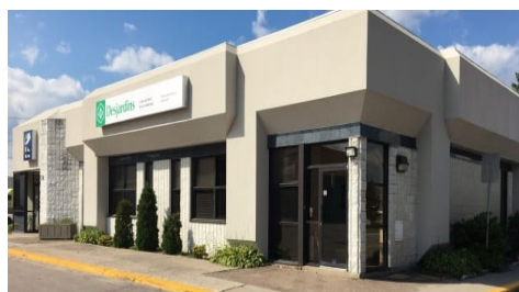
Les bureaux de Maria Express ont été relocalisés à l'ancienne Caisse Desjardins du secteur Mistassini.

D epuis le début de l'année, le transport collectif compte de plus en plus d'adeptes. Nous atteignons tout près de 300 membres qui ont effectué plus de 4 500 déplacements soit en taxi-bus ou dans les places disponibles en transport adapté ou scolaire. Le transport d'appoint offert aux groupes communautaires a généré 19 500 déplacements à ce mo-