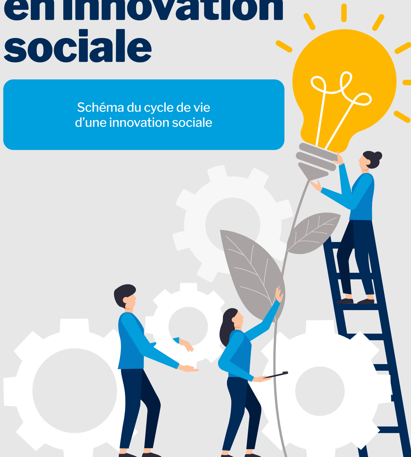
Schéma du cycle de vie d'une innovation sociale