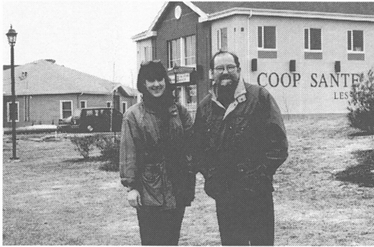
Deux des leaders de St-Étienne-des-Grès